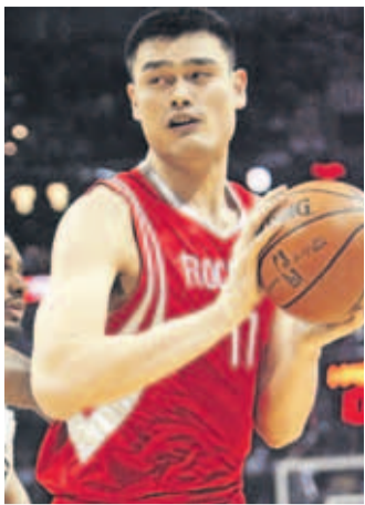
Bleibt Houston erhalten: China-Riese Yao Ming.